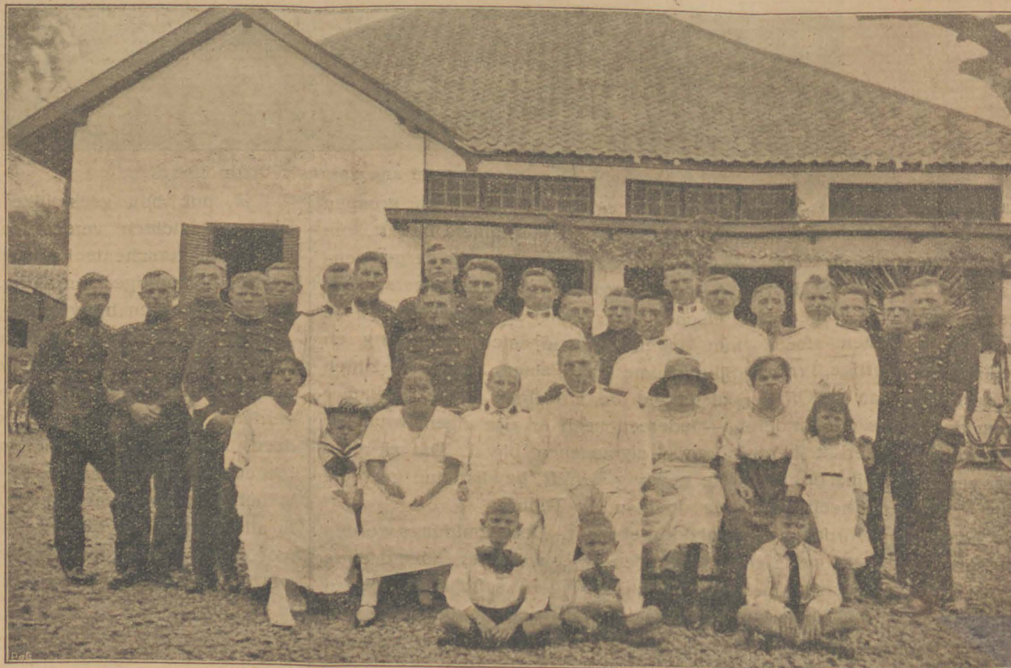
HET MILITAIR TEHUIS TE BANDOENG.