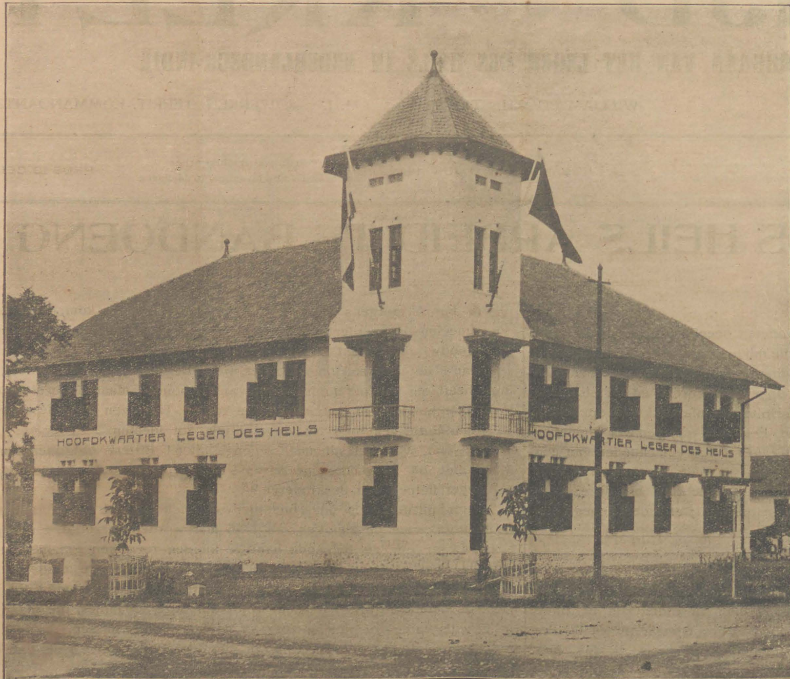
HET HOOFDKWARTIER VAN HET LEGER DES HEILS.